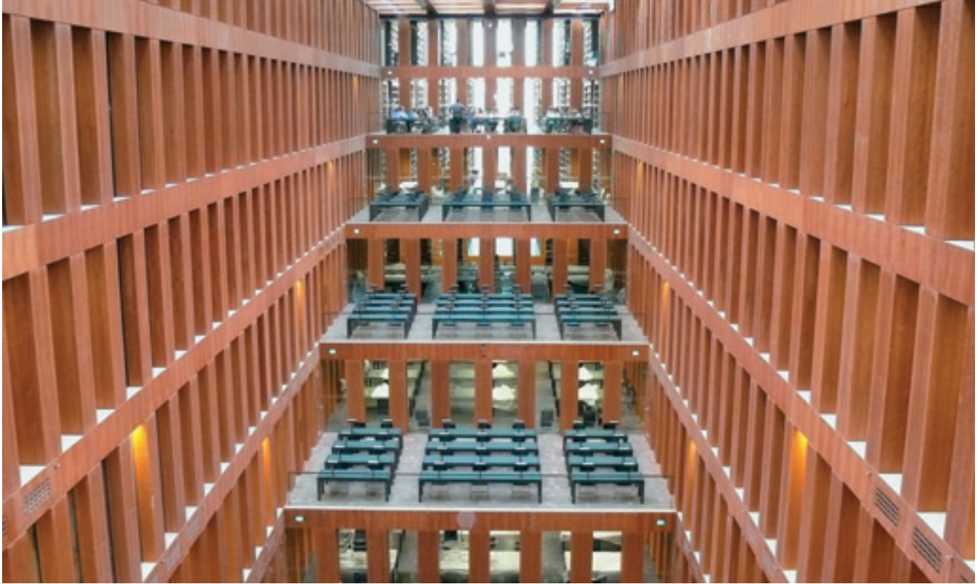
Abb. 3 Der zentrale Lesesaal mit terrassenförmigen Arbeitsebenen. Der direkte Zugang zum Freihandbereich und das durch die Deckenverglasung einfallende Tageslicht bieten ideale Arbeitsbedingungen.

bacher und ich. Die Entscheidung für den Entwurf von Max Dudler und seinen Mitarbeitern haben wir aufgrund unserer Vorüberlegungen getroffen, wie Dauerhaftigkeit in Hinblick auf Funktion und Gestaltung der Bibliothek erzielt werden kann. Neben dem Sammeln und Erschließen ist die eigentliche Funktion der Bibliothek die Vermittlung der in ihr aufbewahrten oder gespeicherten Gedanken und Gefühle. Daraus leitet sich die Schaffung einer anregenden Atmosphäre zur Rezeption von Texten, Bildern und Tönen ab. Besonders wichtig war uns dabei eine qualitativ hochwertige zeitüberdauernde Architektur.