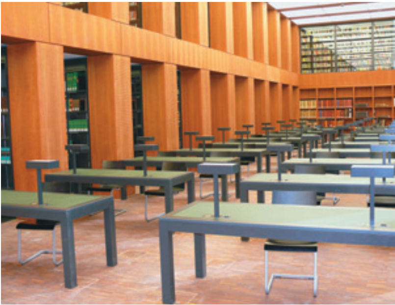
Abb. 5 Der Forschungslesesaal mit direktem Zugang zum Freihandbereich.

die studieren und wissenschaftlich arbeiten, ermöglicht ganz sicher auch die Einrichtung eines Eltern-Kind-Bereichs. Hier können die Eltern lesen und arbeiten, während die Kinder spielen, malen, selbst lesen oder Hörbüchern lauschen. Freiheit bedeutet auch, dass wir keine Nutzungseinschränkungen verhängen, die nicht begründbar und nachvollziehbar sind. Freiheit bedeutet darüber hinaus, die Bibliothek jeden Tag möglichst lange besuchen zu können. Daher wird das Jacob-und-Wilhelm-Grimm-Zentrum Montag bis Freitag von 8.00 bis 24.00 Uhr, an Samstagen, Sonntagen und Feiertagen von 10.00 bis 18.00 Uhr geöffnet.