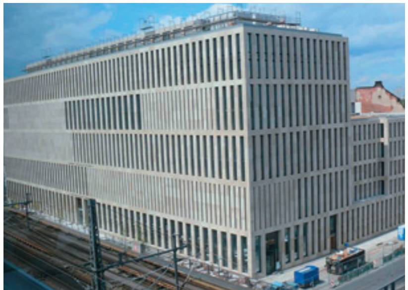
Abb. 2 Das Jacob-und-Wilhelm-Grimm-Zentrum steht in unmittelbarer Nähe zum Hauptgebäude der Humboldt-Universität sowie vieler ihrer Einrichtungen.