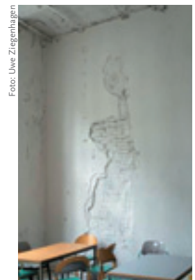
Abb. 2 links: Ein restaurierter, mit moderner Technik ausgestatteter Seminarraum; rechts: Andere Räume im Fakultätsgebäude liegen allerdings noch brach und harren der geplanten Renovierung.