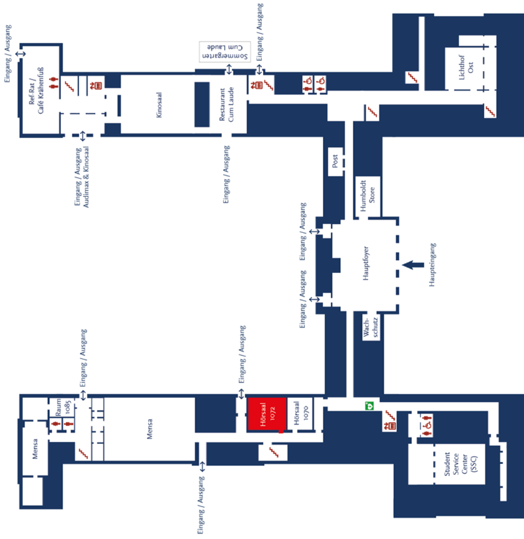
Hauptgebäude - Erdgeschoss